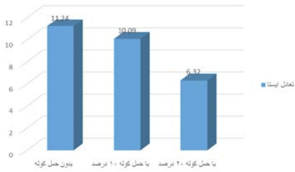
نمودار ۳: مقایسه نمرات تعادل ایستا در سه حالت حمل کوله پشتی (پای برتر)