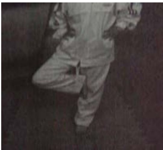
شکل ۱: نحوه اجرای آزمون لک لک

جهت شروع آزمون تعادل پویا، طول واقعی پا یعنی از خار خاصه قدامی-فوقانی (Anterior Superior Iliac)