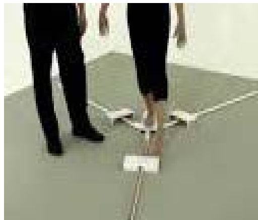
شکل ۲: جهات و نحوه انجام آزمون Y